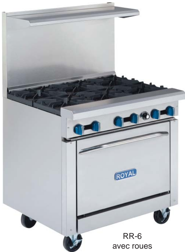
RR-6 avec roues (en option)